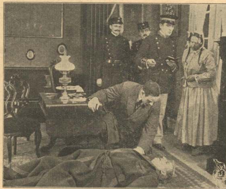
Den gamle Gniers Død.

sig hos Onklen for at tilbagebetale sin Gæld, de 1000 Kroner. Disse Penge har han fremskaffet ved at sælge Hustruens Ridehest. Den Gamle rager gridsk Pengene til sig, og da Nevøen igen er gaaet, aabner han for sit Pengegemme. Pludselig mærker han, at en Fremmed staar i Stuen bag ham. Forstenet rejser han sig. Han