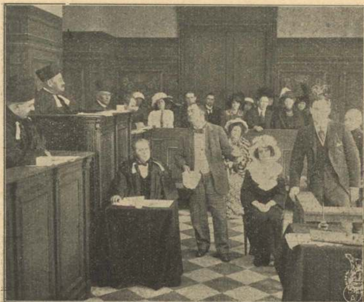
For Rettens Skranke.