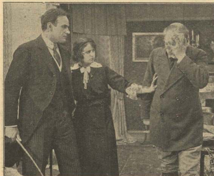
Læge og Advokat.

Der gaar ved denne Trusel et Glædesgys gennem Jomfru Sommer, der overværer Samtalen mellem Onkel og Nevø. Bedrøvet gaar den unge, dygtige